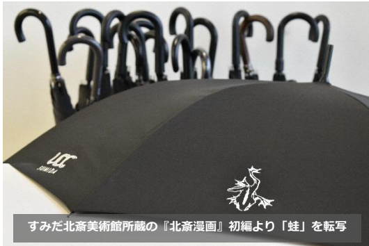
すみだ北斎美術館所蔵の『北斎漫画』初編より『蛙』を転写